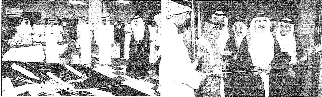
د. المانع يفتح المعرض