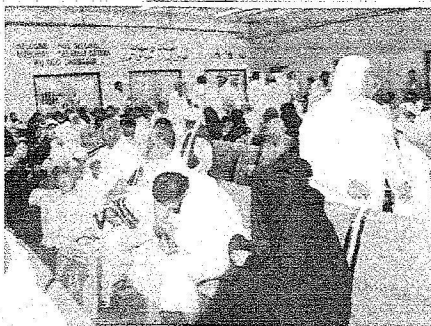
جانب من استقبال ضيوف خادم الحرمين الشريفين

من عدد من الدول الإفريقية ، وهي موريشيوس ، وجوب أفريقيا ، ونيجيريا ، وموتانيا ، الكاميرون ، والسنغال ، وسيراليون ، بالإضافة إلى مسلمين من ألبانيا ، ومن كازاخستان