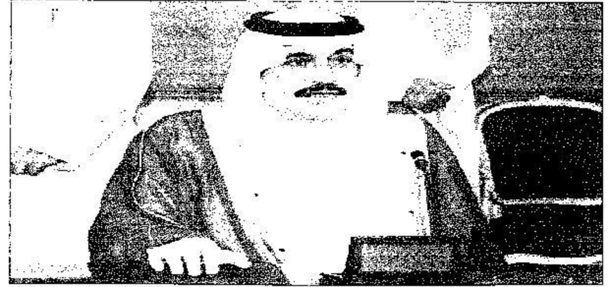
الأمير محمد بن فهد مترأساً مجلس المنطقة الشرقية امس

دور الانعقاد الخامس في قاعة اجتماعات المجلس بإمارة المنطقة ظهر امس ان المنطقة وبحمد الله وتوفيقه ثم بدعم ولاة الأمر تشهد نهضة في جميع المجالات. وثمن سموه اهتمام ومتابعة خادم الحرمين الشريفين وسمو ولي العهد وسمو النائب الثاني «يحفظهم الله» بتلبية احتياجات المواطنين وتوفير كافة الخدمات لراحتهم ورفاهيتهم.