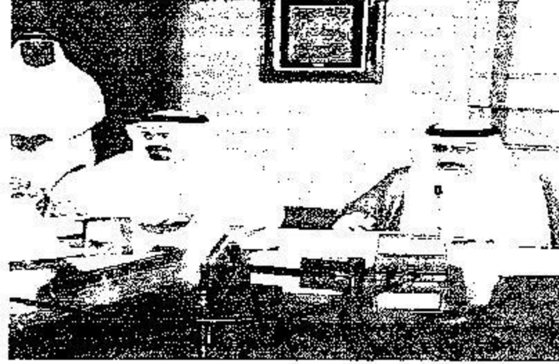
والتحديات على المناطق الزراعية ومعالجة مشكلة المياه وسوسة الخيل وإنشاء جمعية لأصدقاء