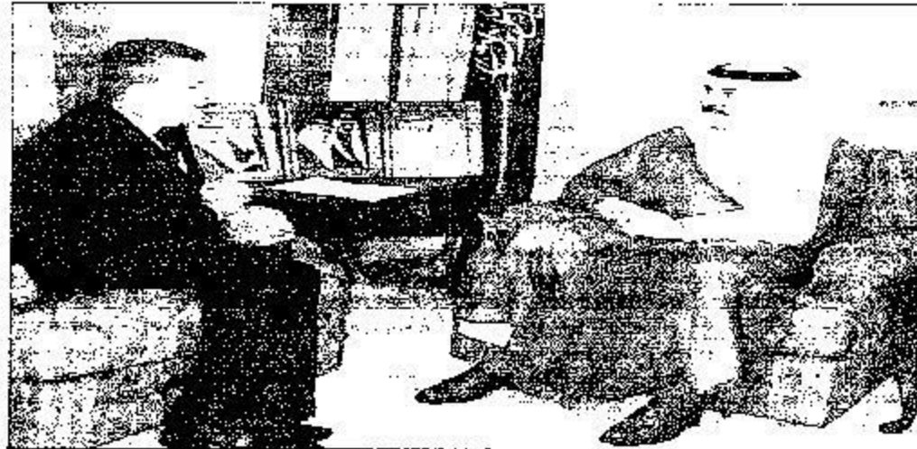
سموه خلال استقباله السفير الفرنسي

مركز خدمي وكان سمو أمير المنطقة الشرقية "حفظه الله" قد استكمل الجلسة بالترحيب بأعضاء المجلس ثم بعد ذلك أذن باستعراض جدول الأعمال، واستمع المجلس لتقرير لجنة التنمية المحلية بالمجلس المتضمن دراسة موضوع إنشاء مركز خدمي شامل يهدف إلى تقديم كافة الخدمات والتراخيص من الإدارات الحكومية الخدمية الدراجين، ودراسة فكرة إقامة ورشة عمل عن رؤية المنطقة الشرقية ثلاثين عاماً مقبلة، ودراسة موضوع مشكلة الإسكان بالمنطقة فيما يتعلق بتوزيع الأراضي لذوي الدخل المحدود، وكذا دراسة موضوع مشروع قطار سريع يربط الجبيل بالدمام وكذلك الدمام بالإحساء بهدف تسهيل حركة تنقل المواطنين بين هذه المدن. كما تضمن التقرير أيضاً دراسة موضوع تطوير الخدمات في مطار الملك فهد الدولي بالدمام وإيجاد الحلول المناسبة لذلك.