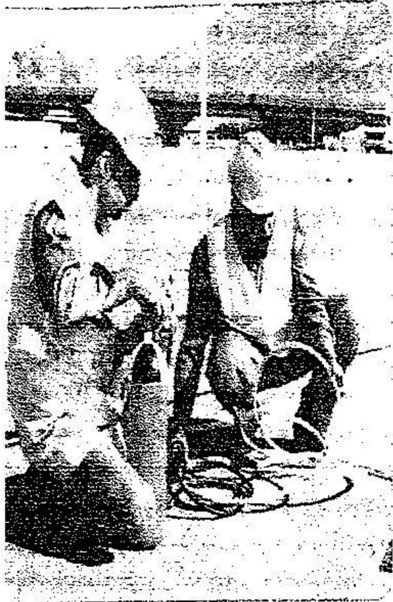
عنصران في تدريب ميداني

التويجري: رصد وقائي لـ ١٢ افتراضا للأخطار المحتملة خلال الحج