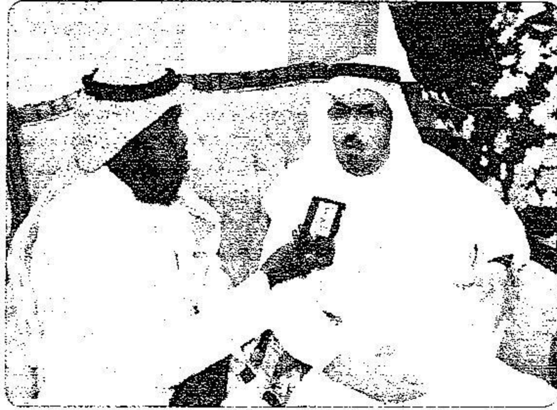
قاضي يتحدث للمدينة

(يد واحدة لا تصفق) ونحن من جانبنا في وزارة الحج والجهات المشاركة معنا نبذل جهودا كبيرة في مجال التوعية. لكن لا بد أن يحظى مفهوم التوعية بعناية خاصة من القائمين بشؤون الحج في بلدانهم، يجب أن يفهموا الرسالة التوعوية وأهدافها وجذورها ومراميها إذا تولدت القناعة عندهم فسوف يزرعوها فيمن بعدهم، والمشكلة أن التغييرات التي تحصل في بعثات الحج ما بين بعثة وأخرى في كل عام تجعلك كأنك تحرت من جديد مع كل بعثة عدا بعض البعثات التي هي محدودة جدا لبعض الدول التي تعتنى بقضية وتقوم نوع الحج في بلدانهم مثل ماليزيا والأرين وهناك جهود مشكورة في مصر، لكن العديد من الدول لا تعتنى العناية الكافية وهذا الأمر ينعكس حتى على راحة حجاجهم، وكما قال الله (وما أرسلنا من رسول إلا بلسان قومه) وعندما توعي الحاج بنفس لغة بلاده وعن طريق أئمة مساجدهم ووعاظهم وبعثاتهم قبل قدومهم له بعد أكثر، كيف تحضر الحج من الابتعاد عن الزحام والابتعاد عن التعرض لضربات الشمس وعدم حمل الأمتعة والحاج في طريقه للحرم الشريف أو جسر الجمرات والابتعاد عن كل ما يسبب لإخوانه الحج، سلسلة من القضايا تحتاج إلى دراسات متعمقة وعناية.