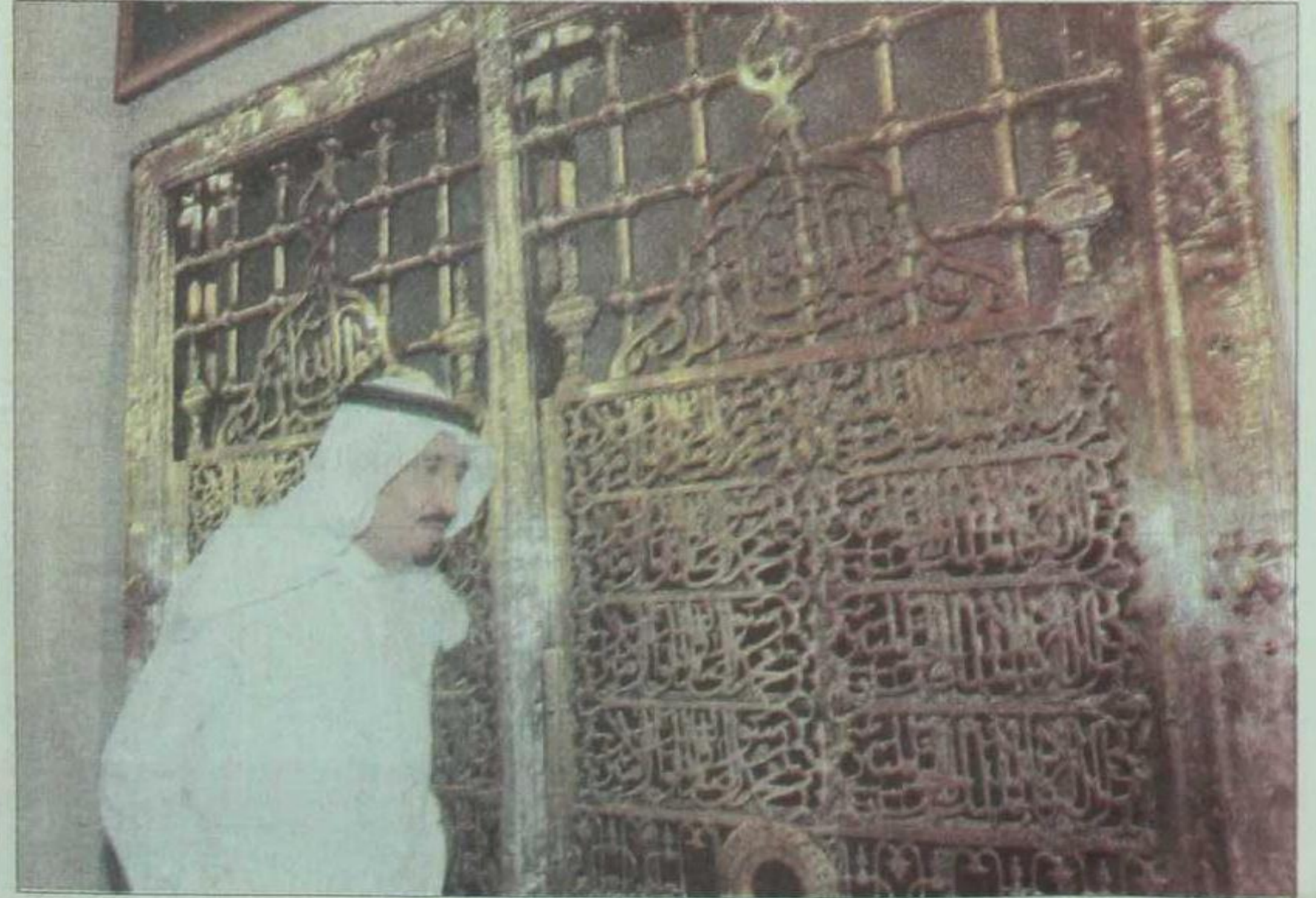
الامير سلمان بن عبد العزيز لدى زيارته المسجد النبوي الشريف