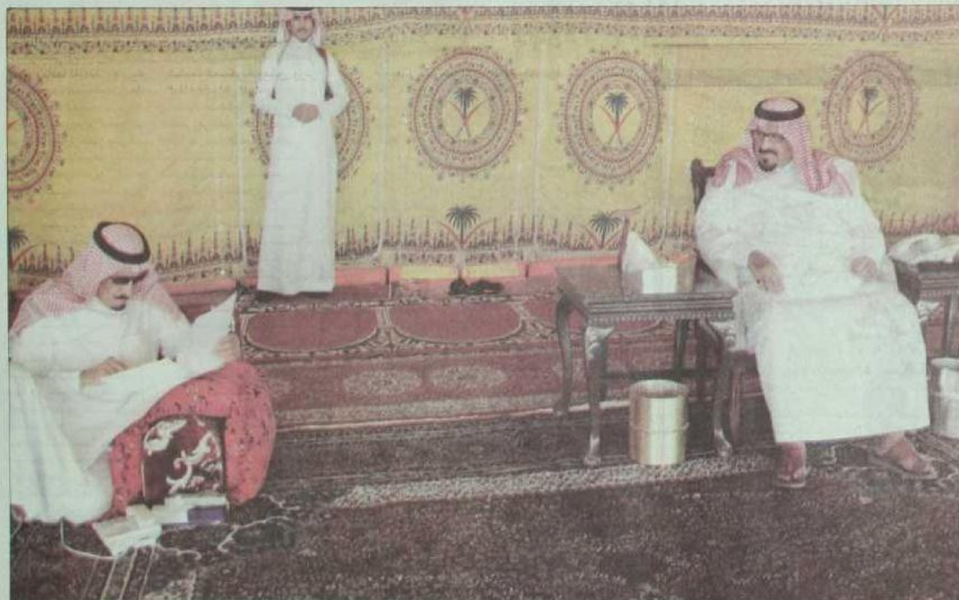
الرائل الأمير سلطان بن عبد العزيز والأمير سلمان بن عبد العزيز أثناء وجودهما في أحد المخيمات خارج مدينة الرياض