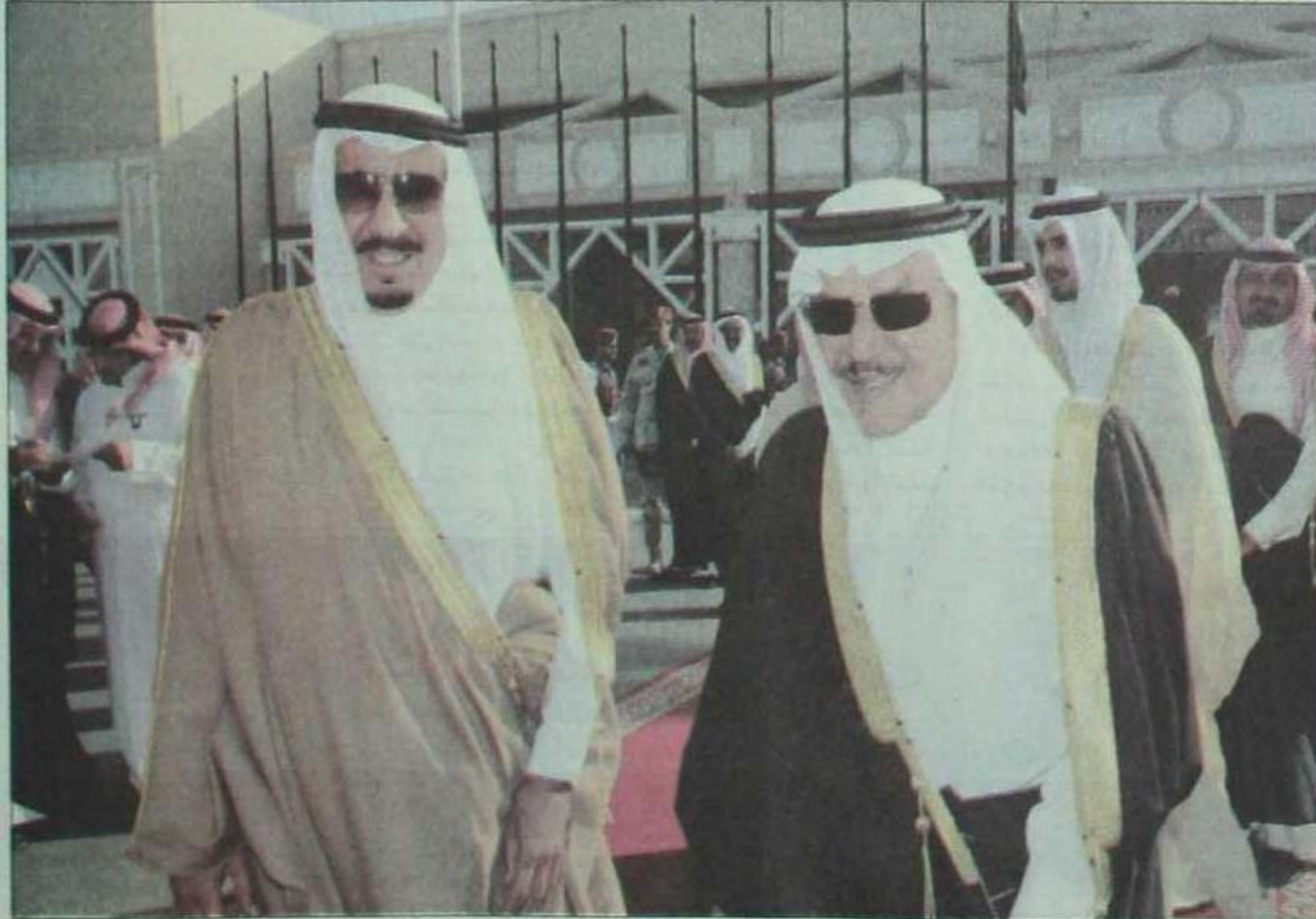
الامير نايف بن عبد العزيز ولي العهد والى جانبه الامير سلمان بن عبد العزيز

التاريخ: 2011-11-06 رقم العدد: 12031 رقم الصفحة: 2 مسلسل: 4 رقم القصاصة: 2