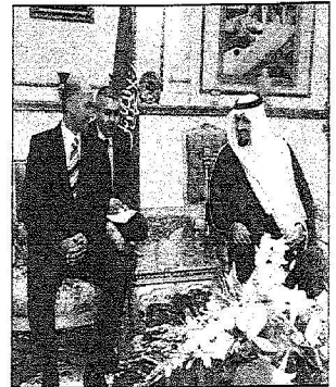
سمو ولي العهد خلال حفل المشاء