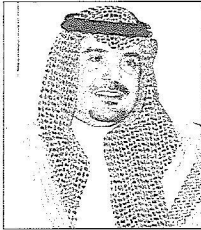
الأمير عبد العزيز بن ماجد

وسيتفضل خادم الحرمين ،حفظه الله، اليوم بافتتاح العديد من المشروعات ويضع حجر الأساس لمشروعات أخرى ومعها افتتاح مبنى إدارة منطقة المدينة المنورة الجديد بحي الزاهدية وسط المدينة على مساحة 23500م 2 وهو في موقع مميز يسهل الوصول إليه من جميع جهات المدينة المنورة تسهيلاً على المواطنين بقول المهندس عبدالكريم بن سالم الخديني إنه نظراً لأهمية المبنى وموقعه المميز فقد تم وضع تصميمه ليكون معلناً من معالم الحاضرة العمرانية الإسلامية على مستوى منطقة