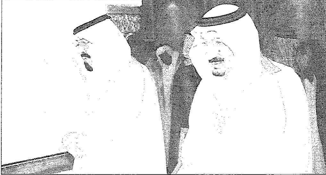
الملك يصلي في المسجد النبوي خلال زيارة سابقة

الله ثم بفضل القيادة الرشيدة وعلى رأسها خادم الحرمين الشريفين الملك عبد الله بن عبد العزيز وولي عهده الأمير سلطان بن عبد العزيز - الملك الأمير سلطان بن عبد العزيز - حفظهما الله.