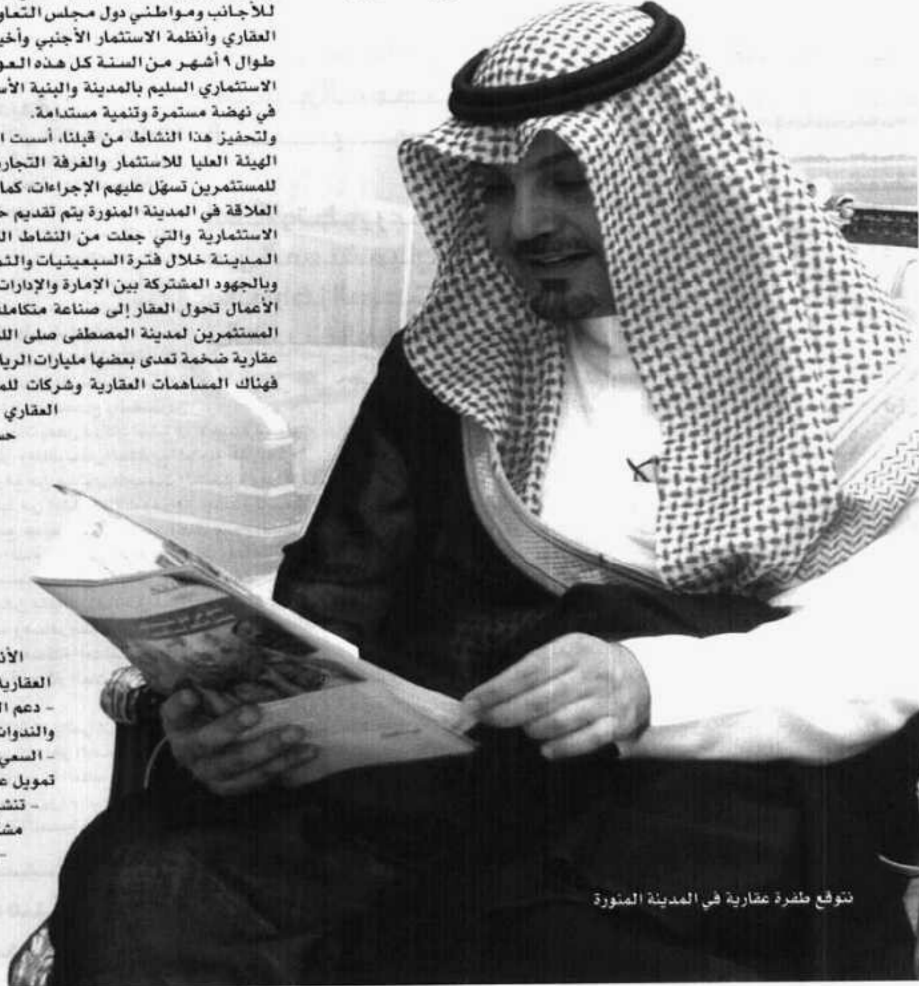
توقع طفرة عقارية في المدينة المنورة

ونتيجة لذلك فقد تقدمت إحدى الشركات الوطنية المتخصصة في هذا المجال بإنشاء محطات لتنقية المياه في كل من محافظة ينبع وخبير والحناكية وسيتم لاحقاً طرح مشاريع أخرى بإنشاء محطات تحلية للمياه في باقي المحافظات؛ وذلك وفقاً لمخرجات المخطط الإقليمي ومؤشرات النمو السكاني والاحتياجات