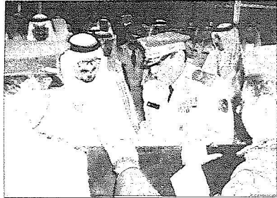
... ويتسلم هدية تذكارية