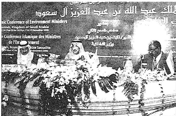
الأمير تركي بن ناصر أثناء اللقاء كلمته

تحت رعاية خادم الحرمين الشريفين الملك عبدالله بن عبدالعزيز آل سعود - حفظه الله- انطلقت صباح أمس جلسة العمل الاولى للمؤتمر الاسلامي الثاني لوزراء البيئة بقصر المؤتمرات بمحافظة جدة.