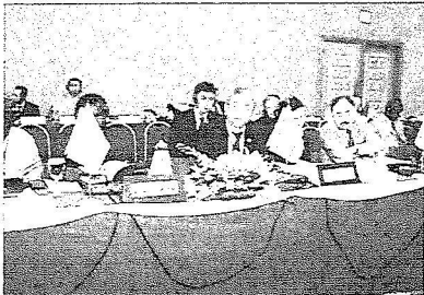
جانب من الوفود العالمية