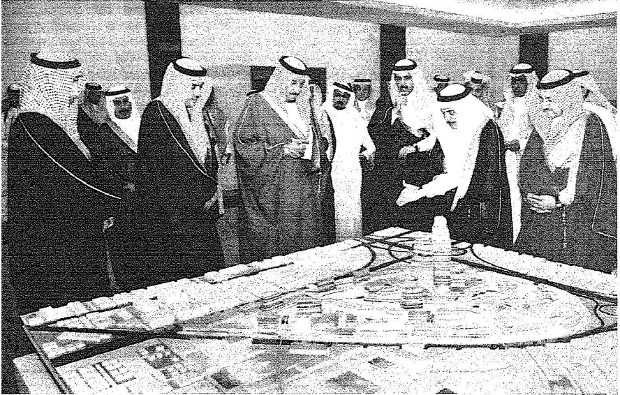
أمير الرياض يستمع إلى شرح عن المدينة التقنية التي تحتضنها الرياض.