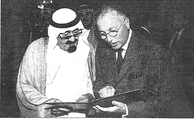
خادم الحرمين الشريفين يستمع لشرح من البروفسور أوغلي حول المركز