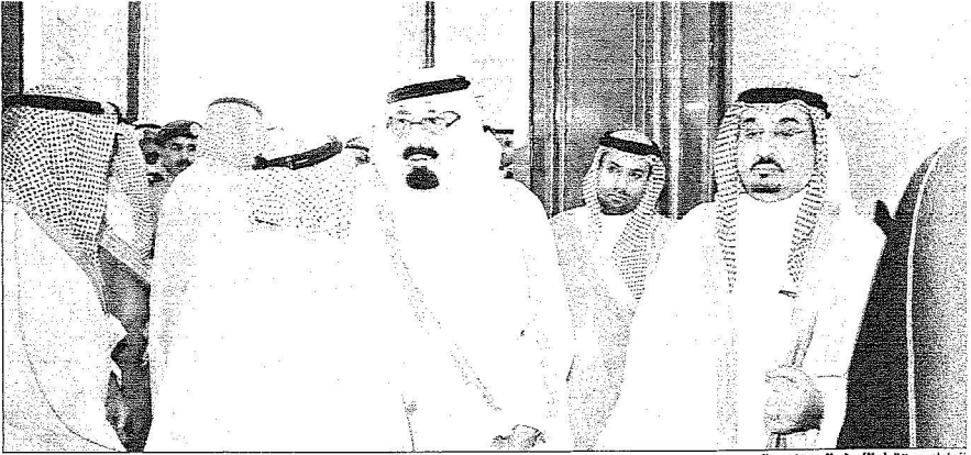
الملك يستقبل الامراء المهنيين بالعيد