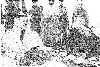
□ حائل / عبدالعزيز العباد و محمد الصنويتي :

.. كل من حوله .. اسألوا كل الضعفاء .. الذين أصبحوا .. بلا تردد .. باتونه من اسماك بعيدة .. وكان خلائها سموه .. قريبا من هؤلاء .. ومن ماله الخاص .. يعالج مشاكل الكثيرين بسخساء .. ومن يعرف الامير عبدالعزيز .. يظن انه يملك بعد هذه الفترة في حائل العديد من المواقع المهمة .. وإن طلبها .. ربما كان كل اهالي حائل قد اهلوها له دون ان يطلب .. حبا به واعجابا .. ولكنه الامير عبدالعزيز بن سعد .. الامير الشهم .. والصادق الامين .. والمحِب بلا مصالح شخصية .. كان لحائل ولاهبا افلا يستحق أن نكتب ونكتب له وعنه كل هذا !!