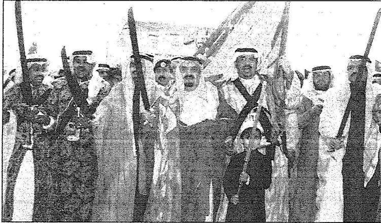
الأمير مشعل يشارك بالمعرضة مع حفيده

بحرنا إلى انه سيؤخذ على يد كل من يشير هذه الفتن، ودعا إلى الحد من ظاهرة الإسراف غير المقبول في المهرجان وخص هؤلاء الذين فتحوا مضائق طابعها الإسراف في الولاة ومطالب أن توجه تكاليفها إلى من يستحقها من الفقراء والمساكين. وفي الختام أشاد بجهود خادم