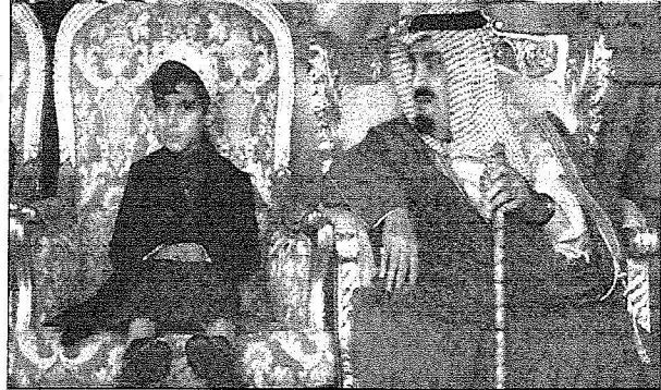
الأمير مشعل وخليفة عبد العزيز