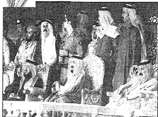
الأمير مشعل أثناء الحقول