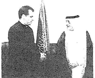
الأمير بندر يصافح الشريك الأمريكي

شهدت مدينة الرياض أمس توقيع أول اتفاقية من نوعها في دول الخليج بين مجموعة زهرة الرياض العالمية وشركة FEEL الأمريكية لإنتاج الطاقة وتحلية المياه عبر الأقمار الصناعية بحيث تكون زهرة الرياض الوكيل الحصري للشركة الأمريكية في السعودية والخليج. وقع الاتفاقية صاحب السمو الأمير بندر بن عبد الرحمن آل سعود رئيس مجلس إدارة مجموعة زهرة الرياض والسيد هاوارد فووت رئيس الشركة الأمريكية وصاحب الاختراع. وقدر صاحب السمو الأمير بندر بن عبد الرحمن آل سعود رئيس مجلس إدارة مجموعة زهرة الرياض -رداً على الجزيرة- أن التكاليف المبدئية لنقل هذه