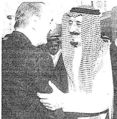
الرئيس شيراك يصادف الامير سلمان