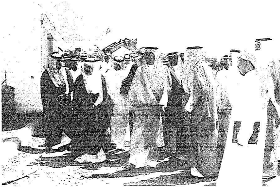
جانب من الزيارة

رعى صاحب السمو الملكي الأمير سعود بن عبدالمحسن بن عبدالعزيز أمير منطقة حائل أمس الأول الثلاثاء حفل افتتاح ملقحي الخطة الزراعي الثاني (الاستثمار الزراعي ضرورة وطنية) الذي يقام في مزرعة المسرة بمدينة الخطة، وفور وصول سموه افتتح المعرض الزراعي الذي تشترك به عدد من الشركات الزراعية الكبرى بالملكة ومعرض للخفوة الحيوانية وتجول سموه داخل أجنحة المعرض واستمع سموه لشرح عن أبرز ما تقوم به الشركات الزراعية بالملكة من جهود لتأمين سلة الغذاء ثم بدأ الحفل الخطابى الذي اقيم بصالة المؤتمرات بالقرآن الكريم ثملقى رئيس لجنة أمناء الملحقى الشيخ على الجميعة كلمة ترحيبية أكد خلالها أن المملكة العربية يساحتها الزراعية الشاسعة التي تفوق ٤ ملايين هكتار تقدر ما عليها من كليات ومشتات ومن تخصيص للتربة بأكثر من ٢٠٠ مليار ريال.