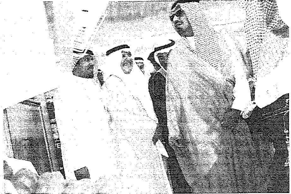
□ تصوير - عبدالله القامدي

وقد نوه أمير حائل بعد نهاية فعاليات الجلسة الأولى بنجاح المنتدى وأثنى على ما طرحه المشاركون بالمتلقي مشيراً سموه إلى أهمية تبني إستراتيجية فعالة لنقل هذه التوصيات إلى أرض الواقع واستفادة القطاع الزراعي والمزارعين منها مؤكداً سموه دعمه الكامل لكل المبادرات التي تصب في صالح للزراعين ومصحة الاقتصاد الوطني.