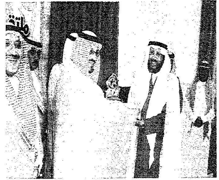
أمير حائل في ملتقى الخطة الزراعي

سموه (الجزيرة)؛ فقد العدة لتكون حائل عاصمة للزراعة والزارعين بالبادرات الشجاعة المستندة للأسس العلمية