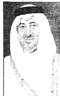
الأمير خالد الفيصل