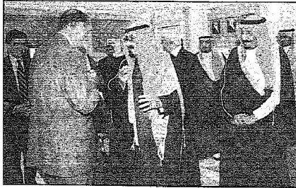
خادم الحرمين لدى وعاظه الرئيس الفرنسي

المصدر : الرياض التاريخ : 07-03-2006 العدد : 13770 الصفحات : 3 المسلسل : 10