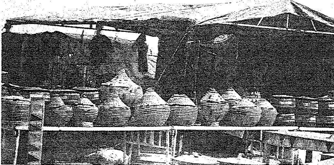
النشاط النسائي يتوزع بين الثقافة والترات

والحاضرات من خارجها فنحن نفخر بثقافتنا الإسلامية ونعتز بتميزها وطابعها الخاص كونها حملت مشعل الحضارة الإنسانية على مر العصور مما يفرض علينا الحفاظ على ثقافتنا الإسلامية العريقة وترأثنا العظيم والحفاظ على ما فيه من ثروة هائلة وما يقوم به المهرجان الوطني لتوصيل الكلمة والفكر والتعبير وإبراز إبداع أفراد المجتمع عامة والمرأة خاصة ليس بالامر السهل فهو يحتاج إلى بذل جهد متواصل من جميع أفراد