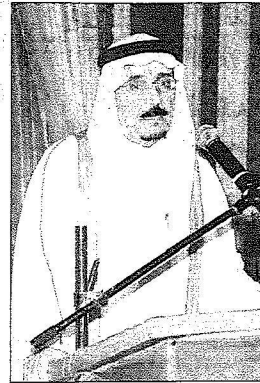
احدى جلسات الشورى