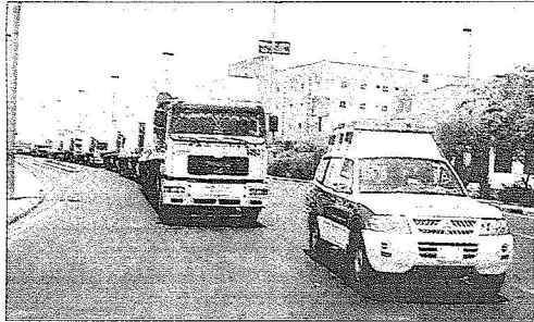
المستشفى الميداني في قافلة الشاحنات متجهاً الى بيروت