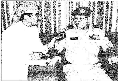
الواء زين يتحدث

كبيرة وأكّد في ختام حديثه ومعداته وسوف يلتحق به فور وصوله وتجميعه طاقم لاستقبال المستشفى عند نقطة الحدود اللبنانية-السورية في العبودية شمال لبنان ليكون مجهزاً لاستقبال المصابين والمرضى والمحتاجين.