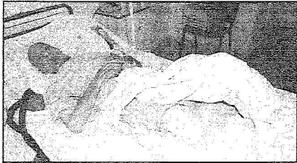
قطعت رجله بسبب الفريغينا وتحملت المملكة معالجته