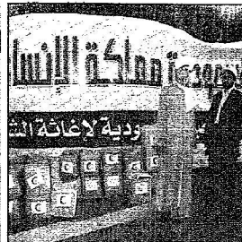
رئيس بلدية مجده عذرج في حديث للزميل السعودي