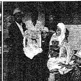
البرك وأطفال سعوديون يحملون توتماً لبنانياً لدى توزيع الحملة أمداء الأمتثال

رئيس بلدية مجده عذرج: المساعدات السعودية شملت مناخا الحياة كافة مدير مستشفى تعانيل: المملكة تكفلت بعلاج النازحين والمتضررين من القصف