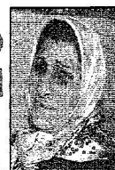
توجة الصباح بالفرجة في حال توجاه