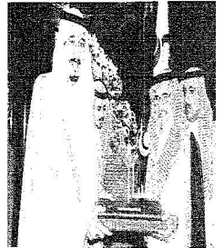
الأمير سلمان بن عبدالعزيز والأمير فيصل بن سلمان من حضور العمل

البدن: لدينا 20 ألف مستفيد ونسعى إلى تغطية جميع المحافظات