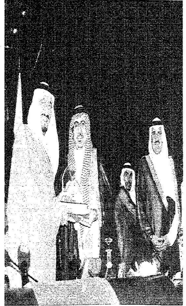
الأمير سلمان بن محمد فيصل السيف مع التكرم شركة العبد للتشيبة الراعية للحفل