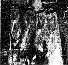
الأمير عبد العزيز بن سلمان والأمير محمد بن فيصل والأمير سلطان بن زيد بن سلمان والأمير أحمد بن زيد بن سلمان

26 مليوناً حصيلة تبرعات جمعية «إنسان» في حفلها الخامس