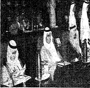
الأمراء سعود، فهد، وليد، وليد، الأمير سلطان بن عبد العزيز خلال حضورهم الحفل