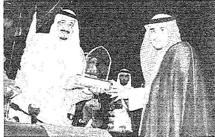
.. ويكرم الأمير خالد بن الوليد.