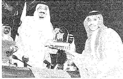
الأمير سلمان يكرم الأمير سلطان بن فهد بن سلمان نيابة عن الأمير عبد العزيز بن فهد.