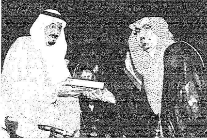
الأمير سلمان يكرم فيصل السيف.