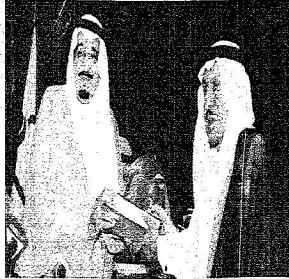
الأمير سلمان بن محمد العبد العزيز الجميح