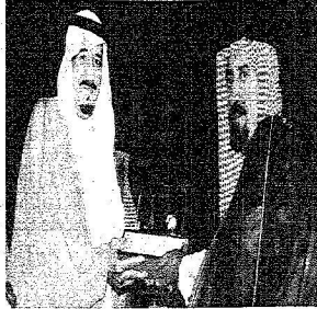
أمير الرياض يكرم الشيخ عبد الرحمن أبو حديد