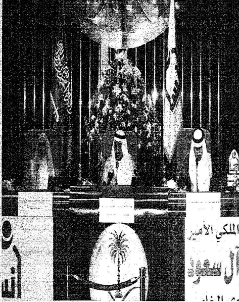
الأمير سلمان بن عبدالعزيز والأمير فيصل بن سلمان والشفي خلال رعاية العمل