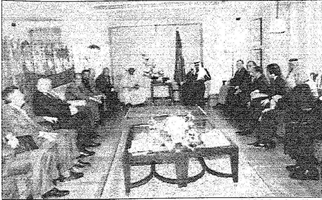
..وحلال لقاء بهم