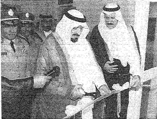
□ المدينة المنورة - مروان قصاص:

بمناسبة بدء العام الجديد رصدت (الجزيرة) تطلعات المواطنين في المدينة المنورة وآمالهم في العام الجديد خاصة في ظل ما تعيشه بلادنا من نقلة كبيرة وتغييرات ملموسة جاءت كنتيجة لتوجهات رائد مسيرتنا خادم الحرمين الشريفين الملك عبد الله بن عبد العزيز رعاه الله الذي يحرص على إحدات تغييرات تصب في مصلحة المواطن ومنها زيادة رواتب الموظفين وزيادة مخصصات عدد من الصناعات الاستثمارية كما وجه في إكمال المشاريع ذات العلاقة بخدمات الدولة للحجاج وكان آخرها تأسيس مدينة الملك عبد الله بن عبد العزيز الاقتصادية بما تحمله من خير كبير للموطن والمواطن، وما زال هناك الكثير.