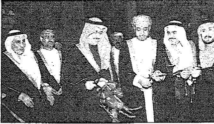
الدكتور المتحمي يقص شريط الفعاليات