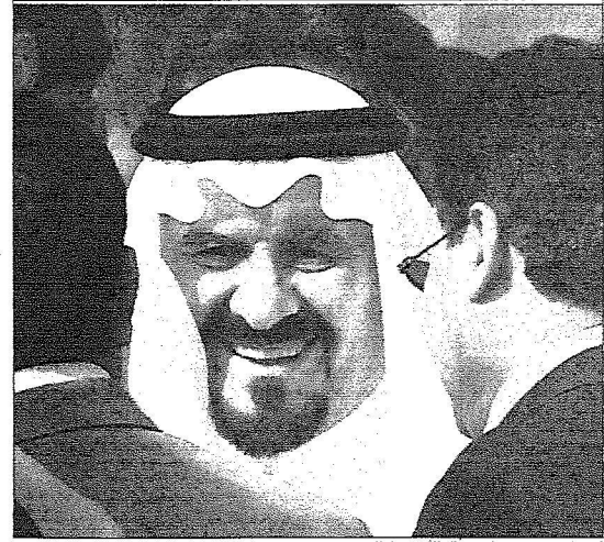
كبار المسؤولين في استقبال الأمير سلطان