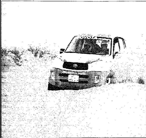
متسابق في المرحلة الأخيرة للسباق