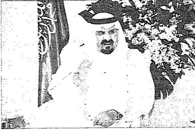
سموه لفاحة أمن الحج، حريصون على خدمة الحجاج