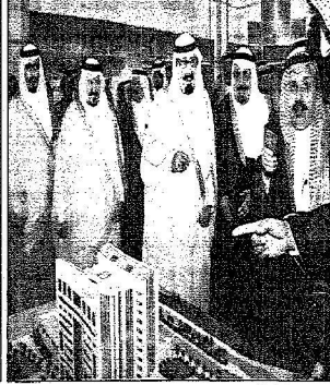
رئيس مشروع في حائل