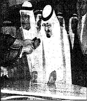
رئيس حجر الأسلي القرحة القوية، يجلسه للتميم