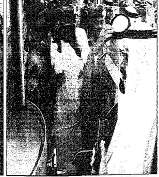
خدم الحرمين الشريفين بفتح مشروع التحلية بالأسامة