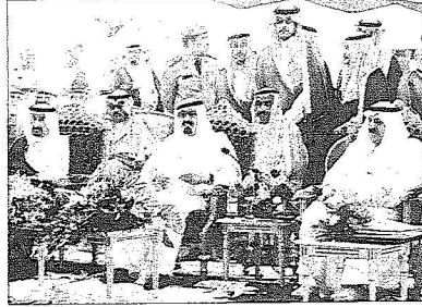
المليك خلال الحقل

ثم عزف السلام الملكي بعد حفظة الله الملك المفدى مقبر الحقل مودعا بقل ما استقبل به من حفاوة وتكريم.