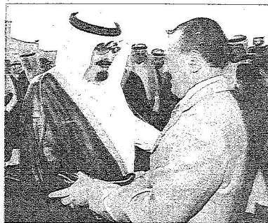
المليك مستقبلا الرئيس صالح