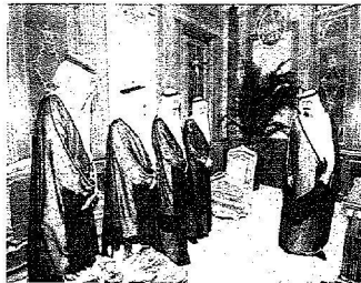
ويستقبل عدداً من السفراء المعيّنين لدى عدد من الدول الشقيقة والصديقة