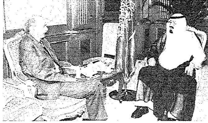
ويستقبل وليد جنبلاط

على نعمته علينا بأن سخّر لنا فالحمد لله والشكر لله). وعاهد الأطفال في كلمتهم خادم الحرمين الشريفين بأن يكونوا أبناء صالحين لهذا الوطن المعطاء وأن يكونوا على قدر الثقة الكريمة فيهم جميعاً ليسهموا في مسيرة تعامل البناء في المملكة العربية السعودية.. وأكدوا متابعتهم بكل فخر موقف خادم الحرمين الشريفين - أيده الله - الشايف في محاربة الإهاب والسير على نهجه في هذا حماسة للبلاد من تغلغل هذا البلاء في المدارس والبيوت وعدم السماح لأحد أن ينشر مثل هذا الفكر الدخيل بينهم في أي حال من الأحوال. وفي ختام الكلمة دعوا الله لخادم الحرمين الشريفين بطول العمر ودوام الصحة والعافية وأن يجزيه عنهم خير ما يجزيه عادل في رعيته. بعد ذلك تشرف الأطفال هائي بن عيسى جرابية وقهد بن أيوب بن حجاب بن نحيث وصخر بن فهد المعطاني الهذلي بإلقاء قصائد بين يدي خادم الحرمين الشريفين.