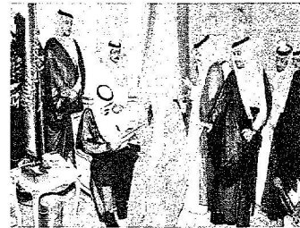
خادم الحرمين لدى استقباله الأمراء والمواطنين