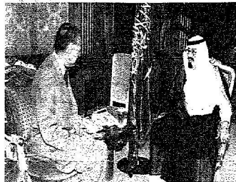
ويلقي الأمير العام لمنحة للتبرع الإسلامي