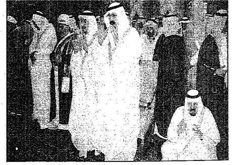
خادم الحرمين يؤدي صلاة العيد بالمسجد الحرام

المصلون توافدوا على الجوامع والمصليات يتقدمهم أمراء المناطق والمحافظون