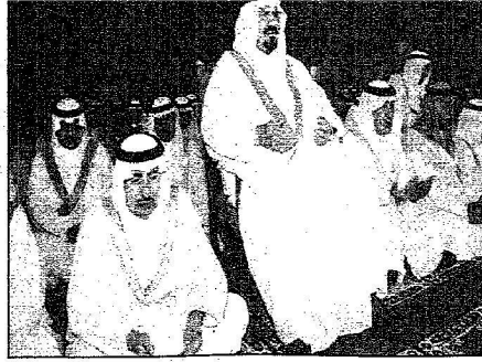
الأمر سلطان يرفع يديه دعاة لله عقب صلاة العيد