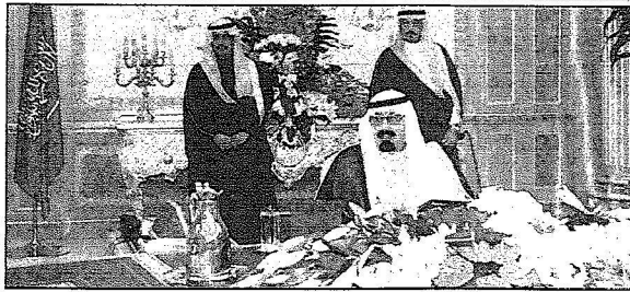
خادم الحرمين مترنم

- عدم المساس بالتوازن الاجتماعي الذي ساد العراق ونسيج التداخل والتأخي والرحم الذي يربط بين