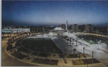
لقطات من مرافق المدينة الجامعية بالأحساء