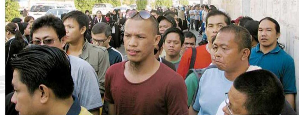
فلبينيون أمام فصيلة بلادهم في جدة بعد إنهاء تصحيح الأوضاع

● وخطة التوقيع الثنائي على مثل تلك الاتفاقيات تأتي رغبة في تعزيز التعاون في مجال توظيف العمالة بطريقة تحقق مصالح البلدين المشتركة، وكذلك الالتزام بالانظمة والتعاليم والآداب والعادات وقواعد السلوك التي يجب مراعاتها أثناء فترة إقامة هذه العمالة في المملكة.