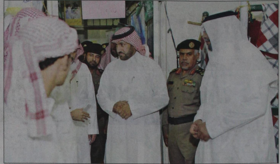
أمير الرياض خلال زيارته للنزلاء في غرفهم واطمأن على أحوالهم وتجاوب معهم الأحاديث

تركي بن عبدالله يزور سجنى الحائر والملز ويلتقي نزلاءهما ويطمئن على أحوالهم: