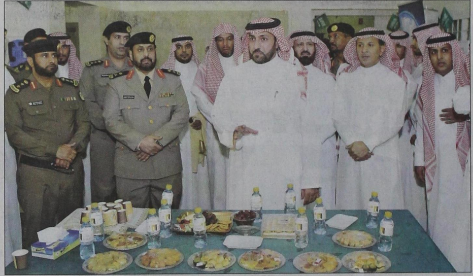
سموه يبادل السجناء التهنة بالعيد