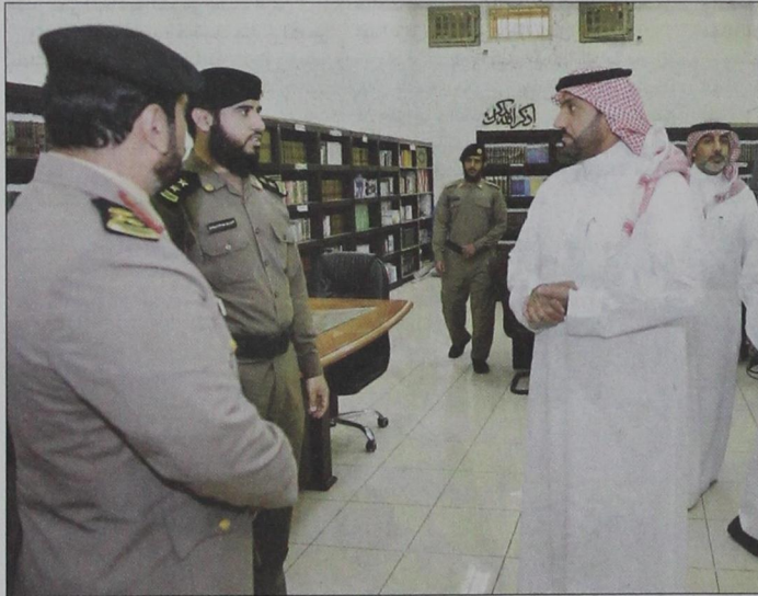
..ويستمع إلى شرح عن قسم الإرشاد والتوجيه بسجن الملز والبرامج التوعوية

التاريخ: 2014-10-05 رقم العدد: 0 رقم الصفحة: 5 مسلسل: 18 رقم القصاصة: 2