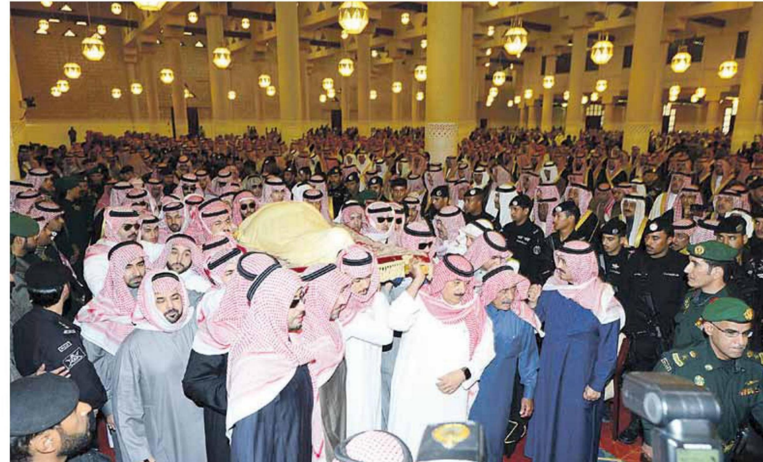
« ولي ولي العهد الأمير مقرن والأمير متعب بن عبدالله يحملان جثمان الفقيد الراحل »

الرياض، واس- اليوم، أدبت صلاة الميت بعد صلاة عصر أمس الجمعة، على الملك عبدالله بن عبدالعزيز آل سعود - رحمه الله -، في جامع الإمام تركي بن عبدالله بالرياض، ثم نقل جثمانه إلى مقبرة العود حيث ووري الثرى. وتقدم جموع المصلين خادم الحرمين الشريفين الملك سلمان بن عبدالعزيز آل سعود، كما أدى الصلاة صاحب السمو الملكي الأمير بندر بن عبدالعزيز آل سعود وصاحب السمو الملكي الأمير ممدوح بن عبدالعزيز آل سعود، وولي العهد نائب رئيس مجلس الوزراء، وصاحب السمو الملكي الأمير محمد بن نايف بن عبدالعزيز ولي ولي العهد نائب رئيس مجلس الوزراء وزير الداخلية، وأدى الصلاة أصحاب ممدوح بن عبدالعزيز آل سعود، وصاحب السمو الملكي الأمير عبدالله بن عبدالعزيز آل سعود مستشار خادم الحرمين الشريفين، وصاحب السمو الملكي الأمير أحمد بن عبدالعزيز آل سعود وصاحب السمو الملكي الأمير مقرن بن عبدالعزيز آل سعود ولي العهد نائب رئيس مجلس الوزراء، وصاحب السمو الملكي الأمير محمد بن نايف بن عبدالعزيز ولي ولي العهد نائب رئيس مجلس الوزراء وزير الداخلية، وأدى الصلاة أصحاب الجلالة والفاخرة والسمو وهم أمير دولة قطر، والرئيس رجب طيب أردوغان رئيس الجمهورية التركية، والرئيس عمر حسن أحمد البشير رئيس جمهورية السودان، وصاحب الجمهورية المتحدة حاكم الشارقة،