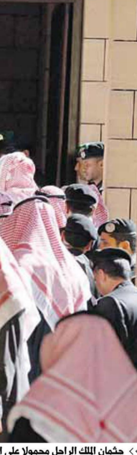
« جثمان الملك الراحل محمولاً على الأعناق »

النائب الثاني لرئيس مجلس الوزراء وزير الداخلية، وأبناء وأحفاد الملك عبدالله - رحمه الله - التمازي في مقبرة الأمة. بعد ذلك نقل جثمان الملك عبدالله بن عبدالعزيز آل سعود «رحمه الله» إلى مقبرة العود حيث ووري الثرى، وتقدم جموع المشاركين في دفن جثمان الفقيد «رحمه الله» في مقبرة العود خادم الحرمين الشريفين الملك سلمان بن عبدالعزيز آل سعود، كما شارك في الدفن صاحب السمو الملكي الأمير عبدالله بن عبدالعزيز آل سعود مستشار خادم الحرمين الشريفين، وصاحب السمو الملكي الأمير أحمد بن عبدالعزيز آل سعود وصاحب السمو الملكي الأمير مقرن بن عبدالعزيز آل سعود ولي العهد نائب رئيس مجلس الوزراء، وأصحاب السمو الملكي الأمراء أبناء الفقيد «رحمه الله» وأصحاب الفضيلة العلماء والمشايخ وأصحاب العالي الوزراء وكبار المسؤولين من مدنيين وعسكريين وجمع غفيرة من المواطنين، داعين الله أن يتغمدهم من الواسع رحمته ويسكنه فسيح جناته.