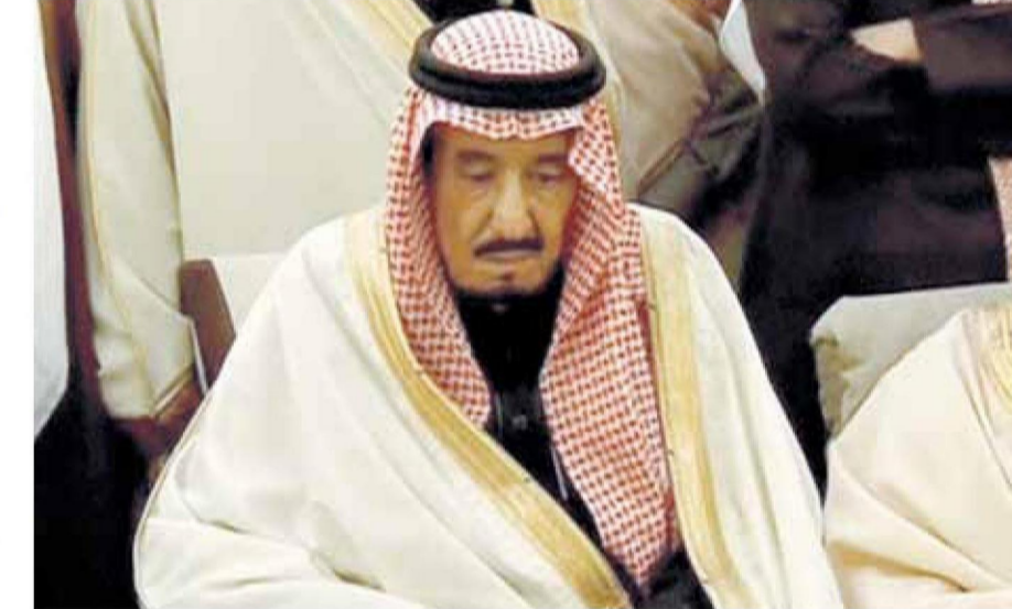
« .. وأثناء صلاة البيت »