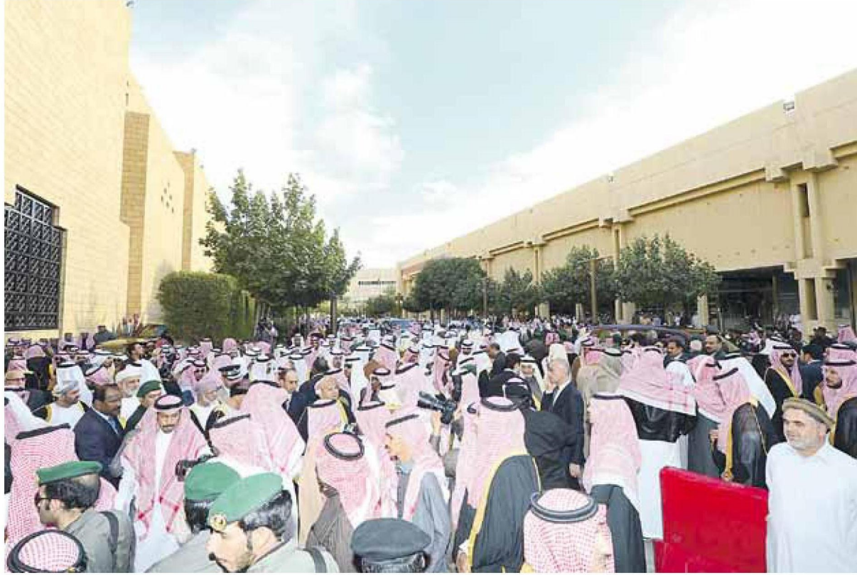
<< جموع غفيرة في وداع القائد الراحل

التاريخ: 2015-01-24 رقم العدد: 2512 رقم الصفحة: 12 مسلسل: 19 رقم القصاصة: 2