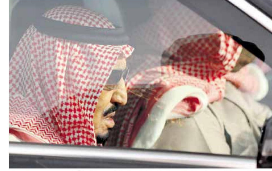
« خادم الحرمين الشريفين الملك سلمان مستقلاً السيارة في طريقه لتشيع فقيد الأمة »