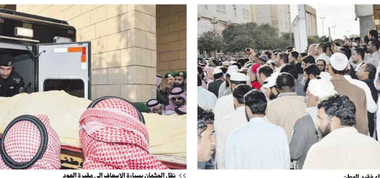
« نقل الجثمان بسيارة الإسفاف إلى مقبرة العود »

الأمير مقرن بن عبدالعزيز آل سعود ولي العهد نائب رئيس مجلس الوزراء، وصاحب السمو الملكي الأمير أحمد بن عبدالعزيز آل سعود وصاحب السمو الملكي الأمير محمد بن نايف بن عبدالعزيز ولي ولي العهد نائب رئيس مجلس الوزراء، وأبناء الفقيد «رحمه الله» وأصحاب الفضيلة العلماء والمشايخ وأصحاب العالي الوزراء وكبار المسؤولين من مدنيين وعسكريين وجمع غفيرة من المواطنين، داعين الله أن يتغمدهم من الواسع رحمته ويسكنه فسيح جناته.