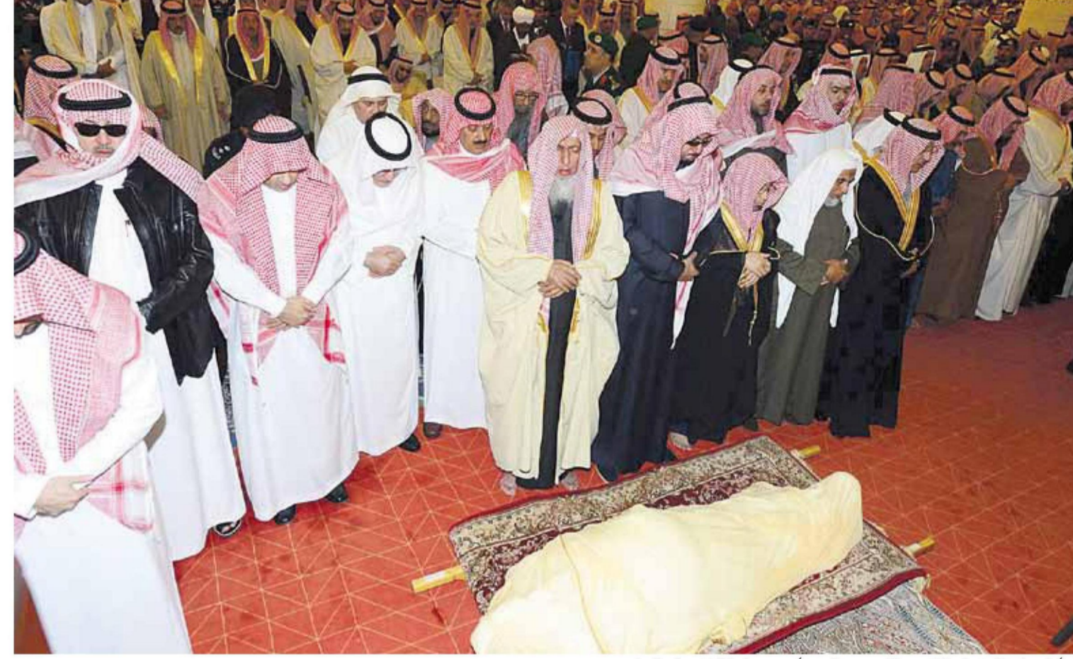
« أداء صلاة البيت على الملك عبدالله بن عبدالعزيز أمس وساحة المفتي يوم الصلین »

الرياض، واس- اليوم، أدبت صلاة الميت بعد صلاة عصر أمس الجمعة، على الملك عبدالله بن عبدالعزيز آل سعود - رحمه الله -، في جامع الإمام تركي بن عبدالله بالرياض، ثم نقل جثمانه إلى مقبرة العود حيث ووري الثرى. وتقدم جموع المصلين خادم الحرمين الشريفين الملك سلمان بن عبدالعزيز آل سعود، كما أدى الصلاة صاحب السمو الملكي الأمير بندر بن عبدالعزيز آل سعود وصاحب السمو الملكي الأمير ممدوح بن عبدالعزيز آل سعود، وولي العهد نائب رئيس مجلس الوزراء، وصاحب السمو الملكي الأمير محمد بن نايف بن عبدالعزيز ولي ولي العهد نائب رئيس مجلس الوزراء وزير الداخلية، وأدى الصلاة أصحاب ممدوح بن عبدالعزيز آل سعود، وصاحب السمو الملكي الأمير عبدالله بن عبدالعزيز آل سعود مستشار خادم الحرمين الشريفين، وصاحب السمو الملكي الأمير أحمد بن عبدالعزيز آل سعود وصاحب السمو الملكي الأمير مقرن بن عبدالعزيز آل سعود ولي العهد نائب رئيس مجلس الوزراء، وصاحب السمو الملكي الأمير محمد بن نايف بن عبدالعزيز ولي ولي العهد نائب رئيس مجلس الوزراء وزير الداخلية، وأدى الصلاة أصحاب الجلالة والفاخرة والسمو وهم أمير دولة قطر، والرئيس رجب طيب أردوغان رئيس الجمهورية التركية، والرئيس عمر حسن أحمد البشير رئيس جمهورية السودان، وصاحب الجمهورية المتحدة حاكم الشارقة،