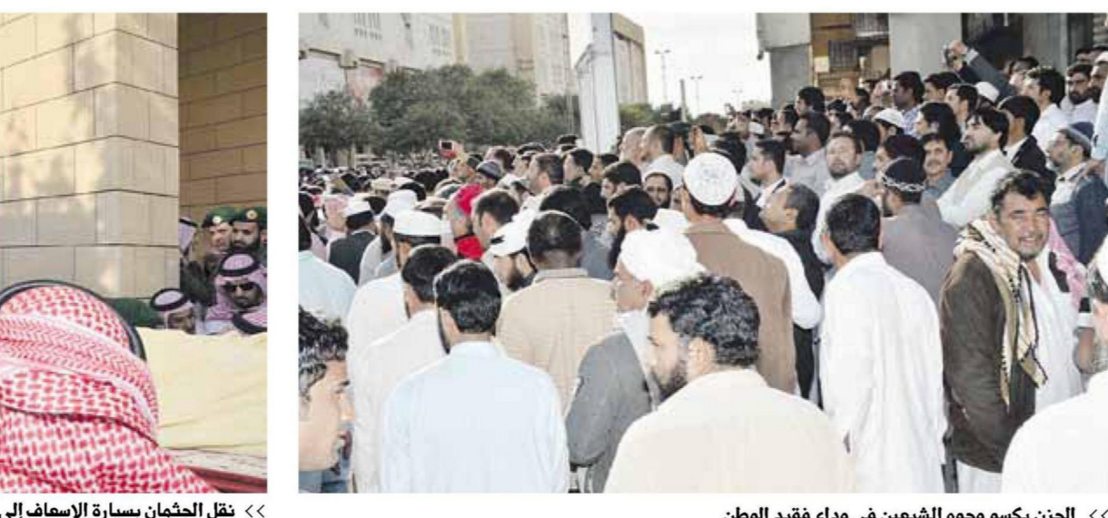
« الحزن يكسو وجوه الشيعين في وداع فقيد الوطن »

وتلقى صاحب السمو الملكي الأمير بندر بن عبدالعزيز آل سعود وصاحب السمو الملكي الأمير ممدوح بن عبدالعزيز آل سعود وصاحب السمو الملكي الأمير محمد بن نايف بن عبدالعزيز ولي ولي العهد نائب رئيس مجلس الوزراء، وصاحب السمو الملكي الأمير أحمد بن عبدالعزيز آل سعود وصاحب السمو الملكي الأمير محمد بن نايف بن عبدالعزيز ولي ولي العهد نائب رئيس مجلس الوزراء، وأبناء الفقيد «رحمه الله» وأصحاب الفضيلة العلماء والمشايخ وأصحاب العالي الوزراء وكبار المسؤولين من مدنيين وعسكريين وجمع غفيرة من المواطنين، داعين الله أن يتغمدهم من الواسع رحمته ويسكنه فسيح جناته.