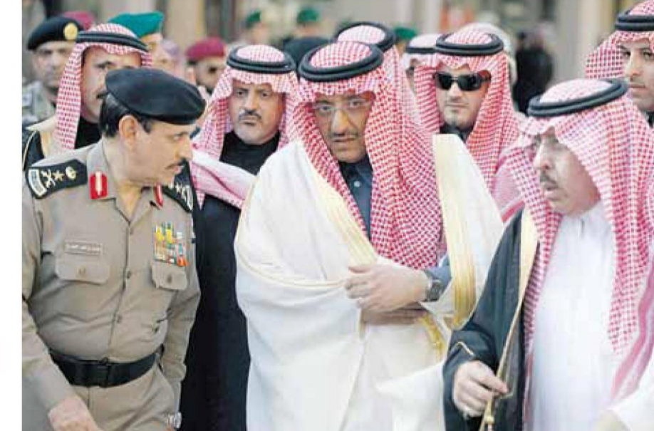
« ولي ولي العهد الأمير محمد بن نايف خلال مراسم التشيع والدفن »