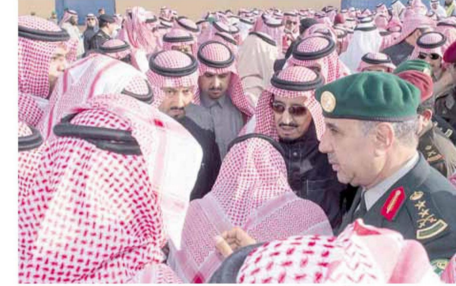
« .. ويتلقى التمازي من الأمراء والوطنيين »