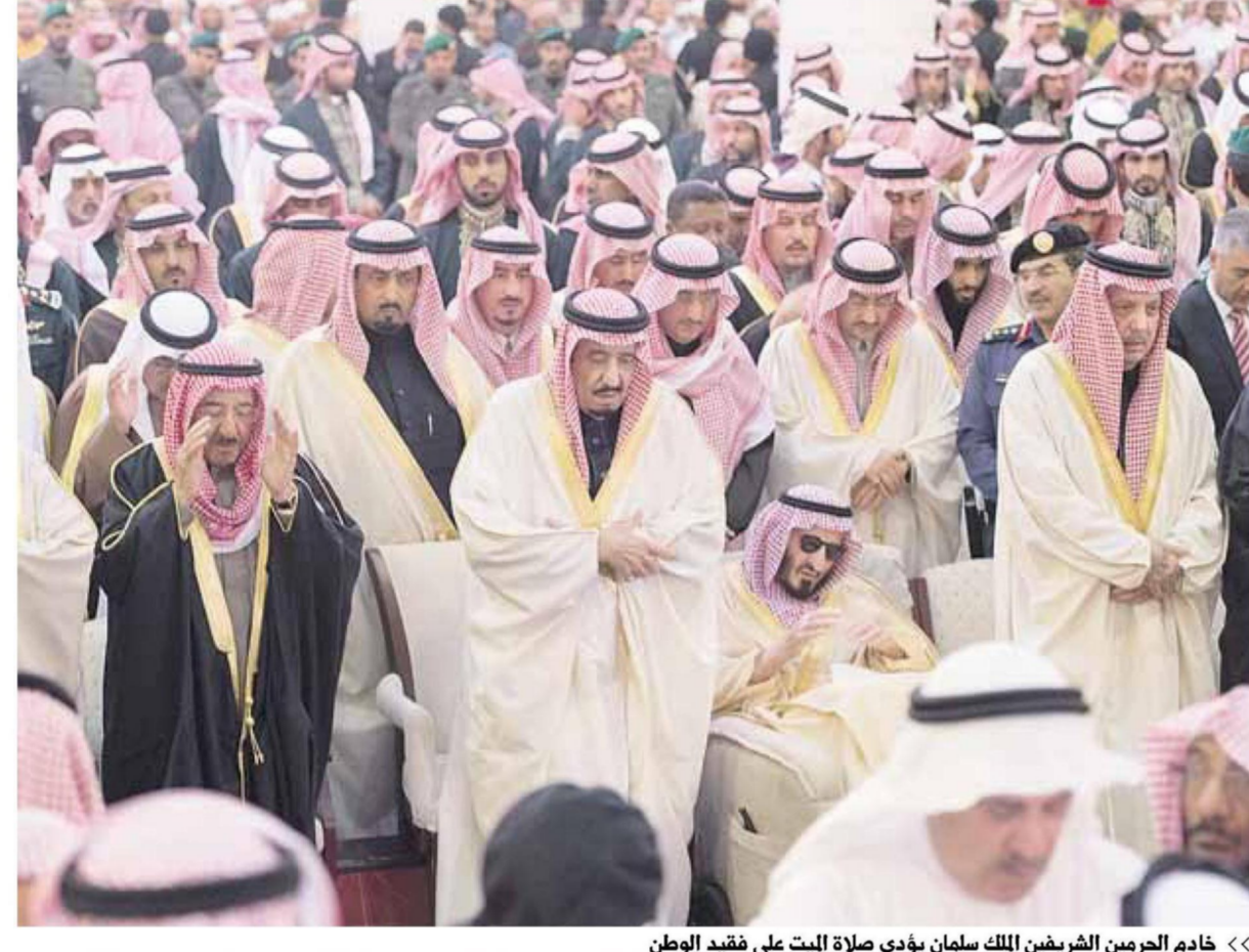
« خادم الحرمين الشريفين الملك سلمان يؤدي صلاة البيت على فقيد الوطن »

وصاحب السمو الشيخ سعود بن مقرن القاسمي حاكم رأس الخيمة، وصاحب السمو الشيخ حميد بن راشد النعيمي عضو المجلس الأعلى بدولة الإمارات العربية المتحدة حاكم عجمان، وصاحب السمو الشيخ عمار بن حميد النعيمي ولي عهد عجمان. كما أدى الصلاة التي أمها ساحة مفتي عام المملكة الشيخ عبدالعزيز بن عبدالله آل الشيخ، أصحاب السمو الملكي الأمراء أبناء وأحفاد الملك عبدالله بن عبدالعزيز آل سعود، «رحمه الله»، وأصحاب السمو الملكي الأمراء وأصحاب الفضيلة العلماء والمشايخ وأصحاب العالي الوزراء وكبار المسؤولين من مدنيين وعسكريين وجمع من المواطنين، وعقب الصلاة تلقى خادم الحرمين الشريفين الملك سلمان بن عبدالعزيز آل سعود والتمازي من أصحاب السمو الأمراء وأصحاب الفضيلة والعالي وكبار المسؤولين، معهم على فقيد الأمة. كما تلقى خادم الحرمين الشريفين التمازي من أصحاب السمو الأمراء وأصحاب الفضيلة والعالي وكبار المسؤولين،