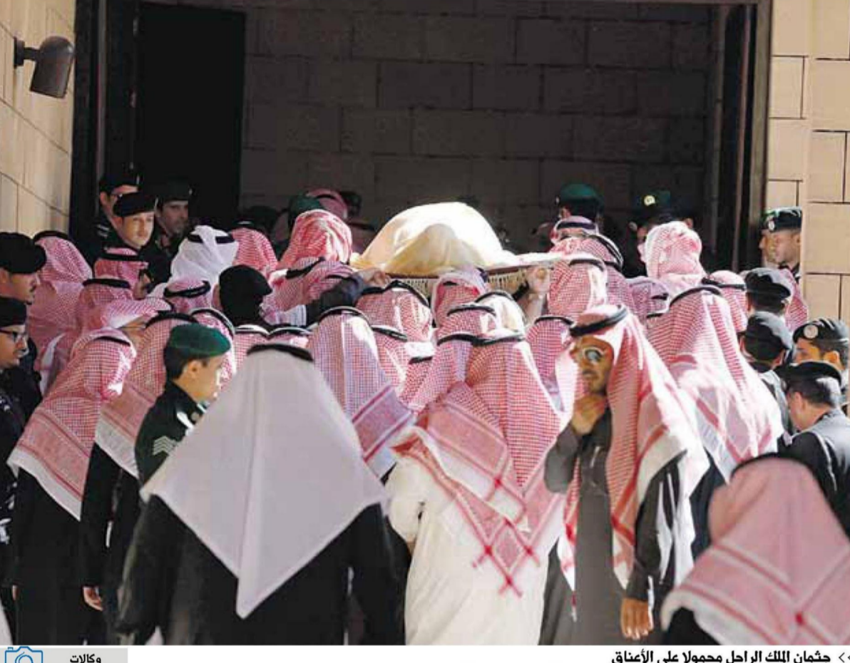
« وكالات »

النائب الثاني لرئيس مجلس الوزراء وزير الداخلية، وأبناء وأحفاد الملك عبدالله - رحمه الله - التمازي في مقبرة الأمة. بعد ذلك نقل جثمان الملك عبدالله بن عبدالعزيز آل سعود «رحمه الله» إلى مقبرة العود حيث ووري الثرى، وتقدم جموع المشاركين في دفن جثمان الفقيد «رحمه الله» في مقبرة العود خادم الحرمين الشريفين الملك سلمان بن عبدالعزيز آل سعود، كما شارك في الدفن صاحب السمو الملكي الأمير عبدالله بن عبدالعزيز آل سعود مستشار خادم الحرمين الشريفين، وصاحب السمو الملكي الأمير أحمد بن عبدالعزيز آل سعود وصاحب السمو الملكي الأمير مقرن بن عبدالعزيز آل سعود ولي العهد نائب رئيس مجلس الوزراء، وأصحاب السمو الملكي الأمراء أبناء الفقيد «رحمه الله» وأصحاب الفضيلة العلماء والمشايخ وأصحاب العالي الوزراء وكبار المسؤولين من مدنيين وعسكريين وجمع غفيرة من المواطنين، داعين الله أن يتغمدهم من الواسع رحمته ويسكنه فسيح جناته.