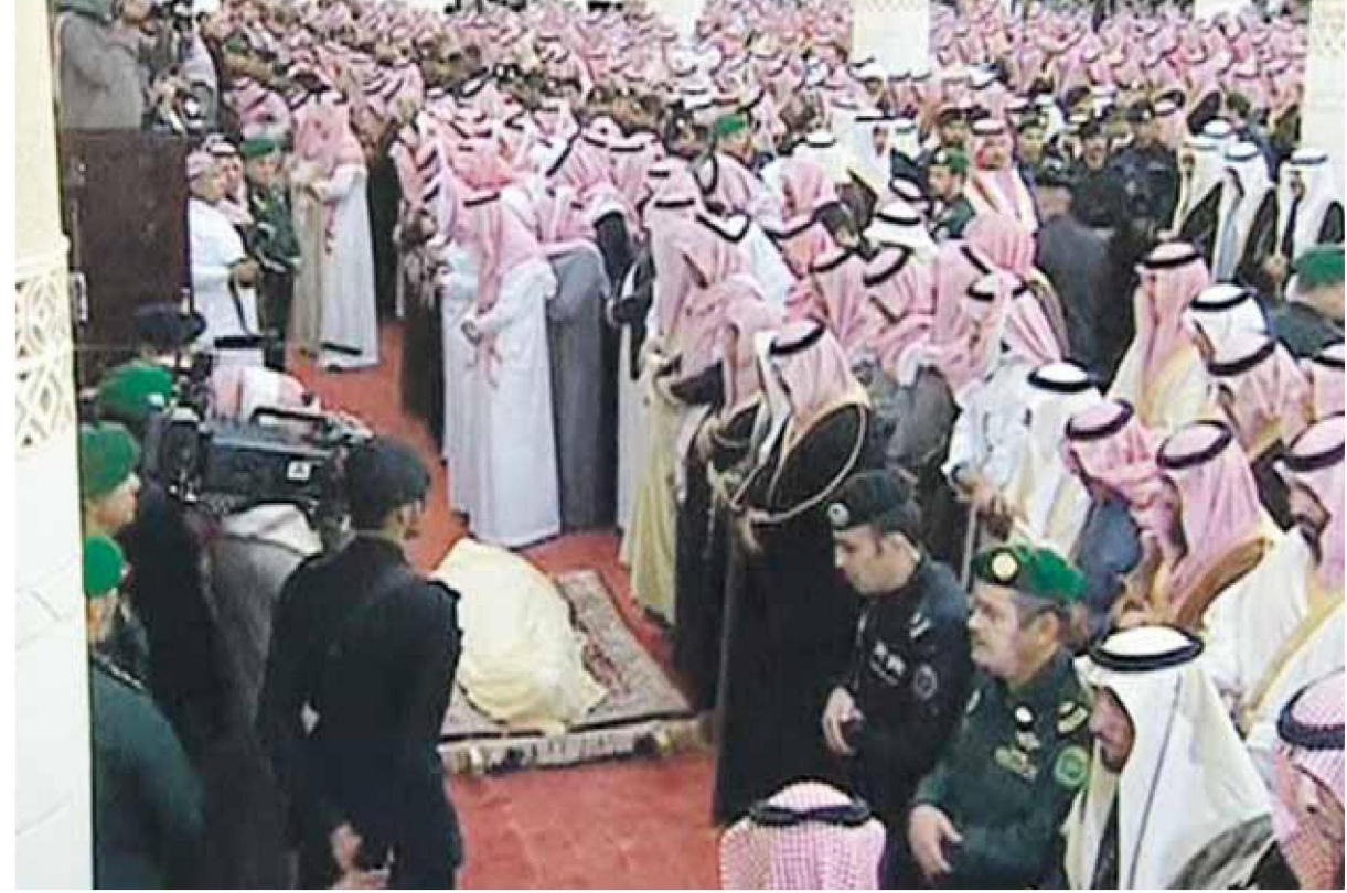
<< الأمراء والمواطنون يؤدون صلاة البيت في جامع الإمام تركي بن عبدالله