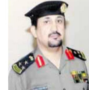
&lt;&lt; العميد عبدالله ابوحكام