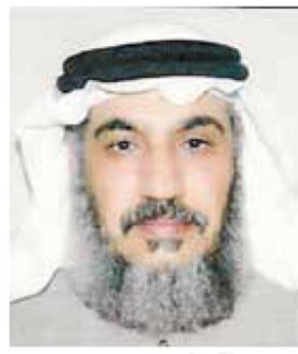
&lt;&lt; حمد الجمل

الملك عبدالله بن عبدالعزيز -رحمه الله- الذي قدم عملا عظيما في خدمة الوطن والمواطنين أدى لاستقرار المملكة أمنيا، وأدى إلى تطورها علميا واجتماعيا واقتصاديا منذ توليه الحكم في هذه البلاد المباركة وحتى توفاه الله امس الجمعة في هذا اليوم المبارك. كما أبايع خادم الحرمين الشريفين الملك سلمان بن عبدالعزيز ملكا وصاحب السمو الملكي الأمير مقرن بن عبدالعزيز ال سعود وليا للعهد وصاحب السمو الملكي الأمير محمد بن نايف وليا للعهد، راجيا الله لهم العون والتوفيق.