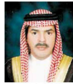
&lt;&lt; عبدالله ابا الجيش