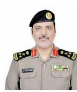
&lt;&lt; العميد راشد الهاجري