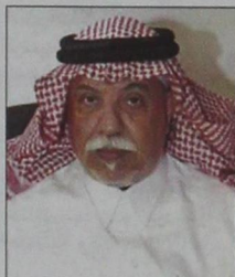
النواء عيسى الزهراني