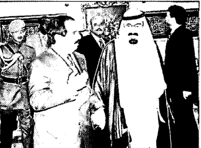
رئيس الاستخبارات العامة وأصحاب السمو الملكي الأمراء وأصحاب العالي الوزراء وسفير خادم الحرمين الشريفين لدى المغرب وعدد من المسؤولين

الدار البيضاء - واس استقبل خادم الحرمين الشريفين الملك عبد الله بن عبدالعزيز آل سعود - حفظه الله - في مقر إقامته بالدار البيضاء يوم الاثنين ١٠ شعبان ١٤٢٩ هـ الموافق ١١ أغسطس ٢٠٠٨ م أخاه جلالته الملك حمد بن عيسى آل خليفة ملك مملكة البحرين الشقيقة والوفد المرافق له. وجرى خلال الاستقبال بحث آفاق التعاون بين البلدين الشقيقين وسبل دعمها وتعزيزها في جميع المجالات إضافة إلى مجمل الأحداث والمستجدات على الساحتين الإقليمية والدولية. بعد ذلك أقام خادم الحرمين الشريفين مأدبة لآخيه جلالته الملك حمد بن عيسى آل خليفة والوفد المرافق له. حضر الاستقبال ومأدبة الغداء