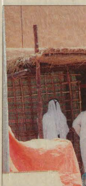
مشاركون من دول مجلس التعاون يعدون جناحهم في قرية الجنادرية.

أوبريت «وحدة وطن» يبرز النسيج المترابط؛ وحدة وانتماء وبناء