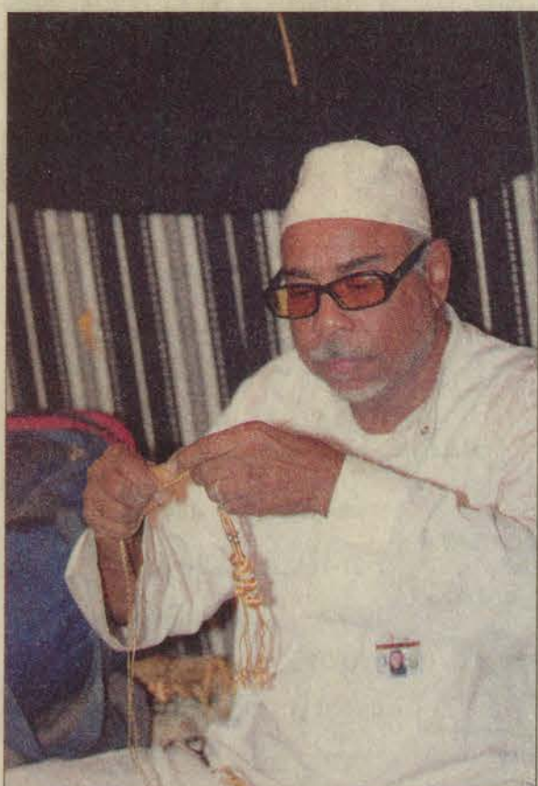
.. وآخر يطرز المشالغ عشية افتتاح القرية.

ويشهد عصر اليوم انطلاق سباق الهجن السنوي