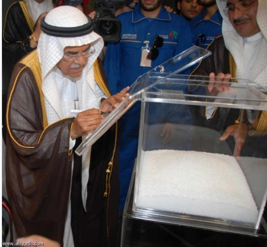
تدشين مشروع بترو رابغ

خفضت مؤسسة النقد العربي السعودي، سعر الريبو العكسي للمرة الثالثة في العام الحالي بمعدل ٢٥ % نقطة أساس إلى ٢٥.