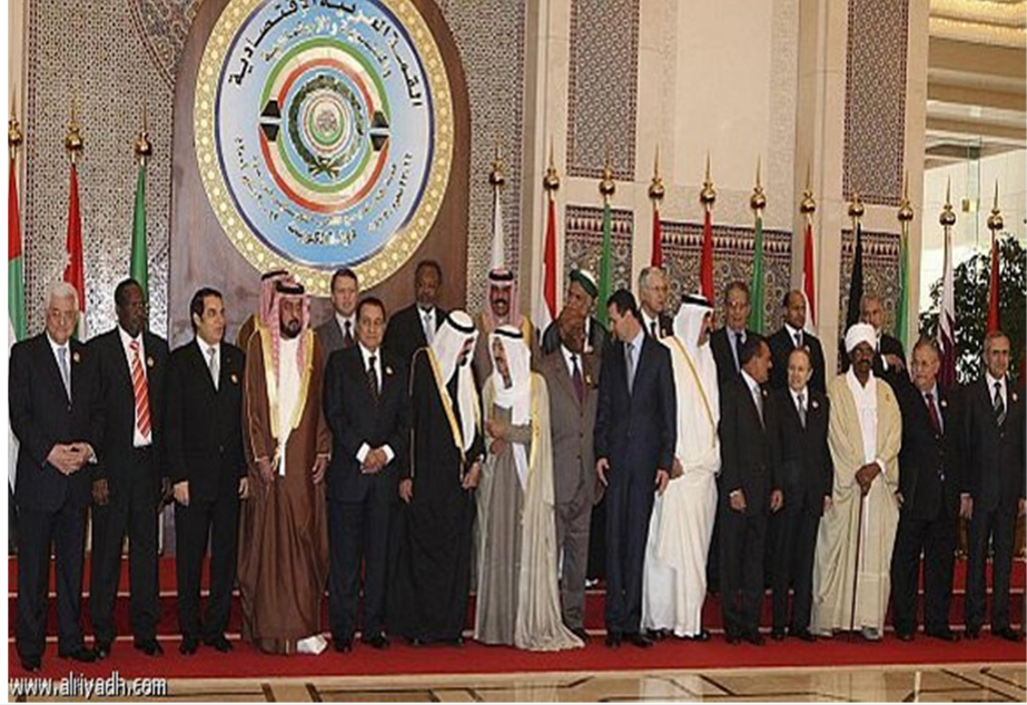
رصد ومتابعة - فيصل العبدالكريم

الملك عبدالله يجدد التأكيد على مواصلة المملكة لمسيرتها الاستثمارية بعيدة المدى.. ويرأس وفد المملكة لقمة العشرين