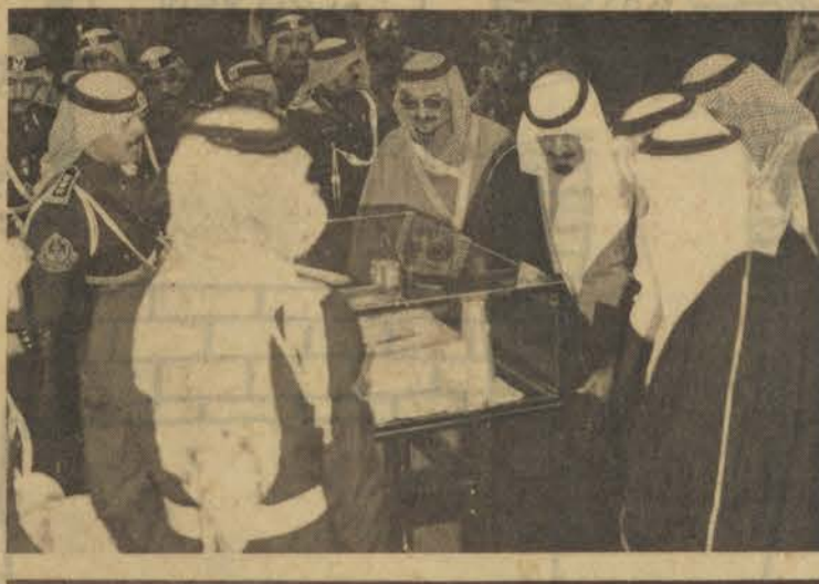
• سمو نائب جلالة الملك يتسلم هدية الكلية وهو مجسم للمصمم