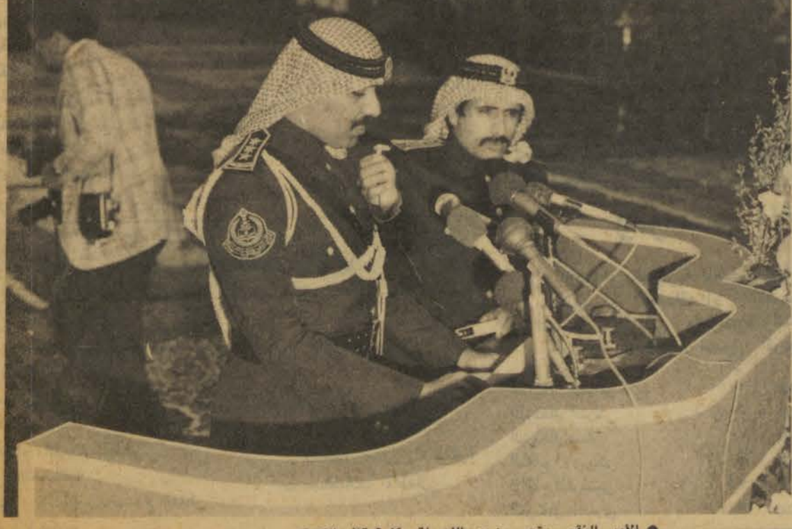
• الأمير النقيب متعب بن عبدالله يلقي كلمة قائد الكلية

وصرح ل ( الرياض ) معالي الاستاذ هشام ناظر وزير التخطيط بقوله بان كل ما كان هناك افتتاح مؤسسة علمية تساعد في تنمية القوى البشرية كلما كان هناك مكسب كبير للمملكة واضاف باننا لا نعتبر المؤسسات في وزارة الدفاع او الحرس الوطني مؤسسات عسكرية - فحسب بل هي مؤسسات حضارية في المقام الأول تساهم في تنمية القوى البشرية وقال باننا نلاحظ بالنظر لمنسوبي الحرس