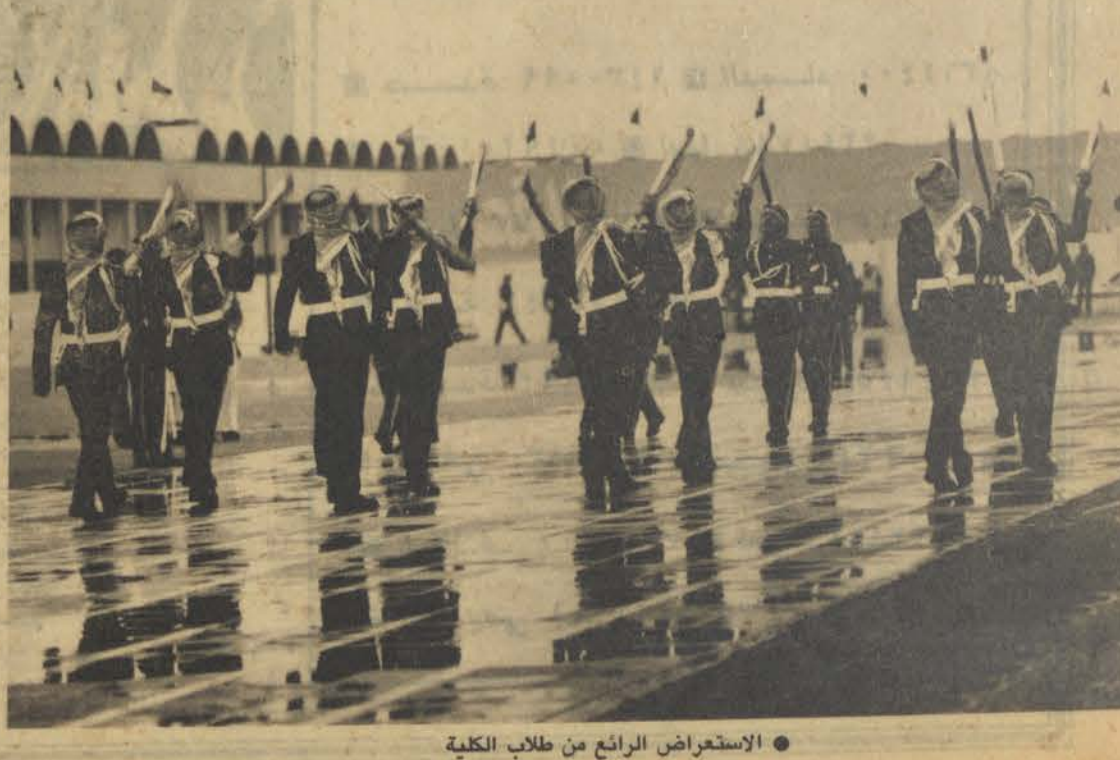
• الاستعراض الرابع من طلاب الكلية