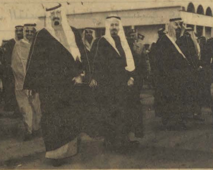
• سموه يتفقد منشآت الكلية .

حضر الحفل عدد من اصحاب السمو الملكي الامراء والمعالي الوزراء وعدد من كبار المسؤولين في الدولة . كان للتنظيم الرائع من قبل المشرفين على الحفل اثره على انجاح الحفل وظهوره بهذا المستوى المشرف . شاركت كوكبة من الخيالة في الاصطفاف في طرقات الكلية مما اعطى منظراً تاريخياً بديعاً حيث كان لمنظر الخيول العربية الاصيلة وقع كبير على الحضور . كان لقصيدة الشاعر