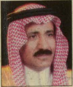
بقلم: محسن بن علي الهمامي