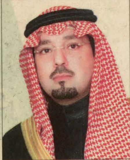
الأمير مشعل بن عبدالله بن عبدالعزيز