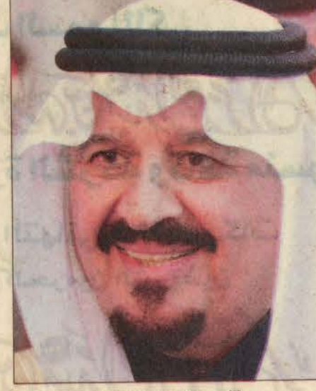
الأمير سلطان بن عبدالعزيز

وقد ارتبطت ذكرى اليوم الوطني السعودي منذ عهد الملك المؤسس -رحمه الله- بالإنجازات والأعمال المفيدة للشعب والأمة، ولم يربط حكام هذه البلاد اليوم الوطني بالاحتفالات والأهازيج التي لا تقدم لشعبهم شيئاً وأصبح اليوم الوطني في ذهن كل مواطن دفعة إلى الأمام وخطوة نحو تحقيق المزيد من الأهداف التنموية ومزيد من الرقي والرخاء والأمن والسلام.