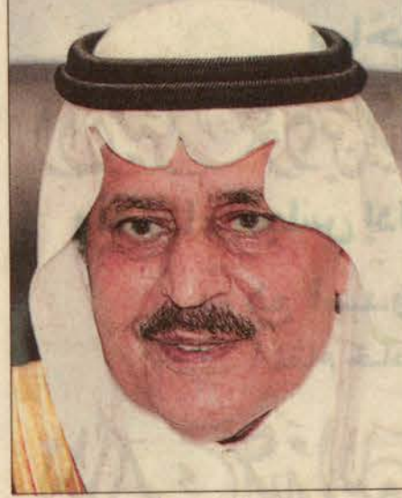
الأمير نايف بن عبدالعزيز