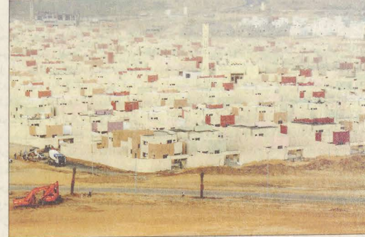
المشروع في مراحلها النهائية