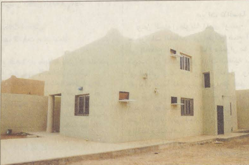
مساحات تناسب العائلة السعودية