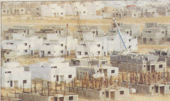
تواصل أعمال البناء

وموقع الزوان الذي بلغته قيمة ١.٠٦٧.٧٥٠ ريالاً وعدد الوحدات السكنية ١٠٦٣، منها ٥٠٠ فيلا سيتم تسليمها بعد ١٢، وموقع الخارش بمبلغ ١.١٩٢.٢٥٠ ريالاً وعدد الوحدات ١٢٤٣، فيلا منها ٥٠٠، فيلا، إلى جانب موقع السهي الذي تبلغ قيمته الإجمالية ٤٧٩.٥٥٠ مليون ريال وعدد الوحدات ٤٤٧، فيلا والمرحلة الأولى التي تسلم بعد ١٢ شهراً تشمل ٣٠٠ فيلا وموقع رمادا والذي تبلغ قيمته ٩٧٥.٢٥٠ مليون ريال وعدد الوحدات به ٩٩٥ فيلا ٥٠٠ فيلا للتسليم. وكانت جميع الشركات المقاوله قد باشرت تنفيذ الأعمال الإنشائية من ردم ورفص الطرق وإسكان العاملين في المواقع المختارة لتنفيذ المشروع وفق نماذج متعددة في التصميم تتفق واحتياجات الأسر المستفيدة مع حرص على توفير المدارس بمختلف مراحلها والمساجد والحدائق العامة وغيرها من الخدمات الأخرى بكل موقع من مواقع تنفيذ المشروع حرصاً على راحة ورفاهية الأولى وتشتمل تنفيذ الوحدات السكنية وواحدة وثلاثين مسجداً وخمسة وثلاثين مدرسة للبنين والبنات، وخمسة مراكز صحية موزعة على المواقع الخمسة، مع