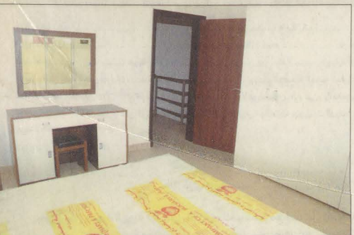
تواصل أعمال تأثيث الإسكان