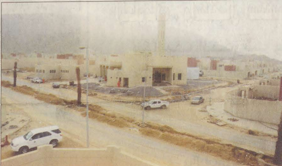
تكمال الخدمات في الموقع