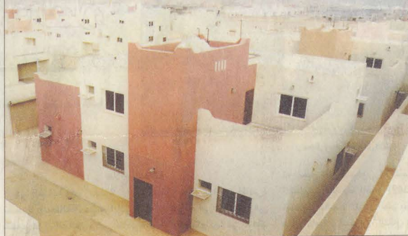
أحد المنازل ويبدو جاهزاً