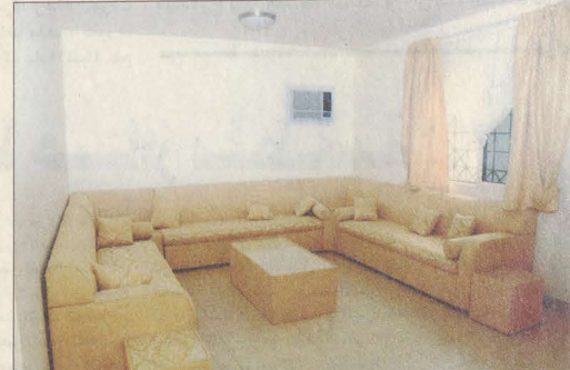
تأثيث راق في المجمعات السكنية