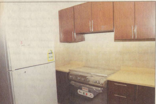
التجهيز لم يغفل الأجهزة الكهربائية

وقال الأمير محمد بن ناصر بن عبدالعزيز إن هذه الوحدات السكنية عبارة عن ٦ مدن كاملة بحد ذاتها ومجهزة بمختلف الخدمات الصحية والتعليمية والاجتماعية وكذلك خدمات المياه والكهرباء، وأشار سموه أن الموقع يضم ستة آلاف وحدة سكنية و٣١