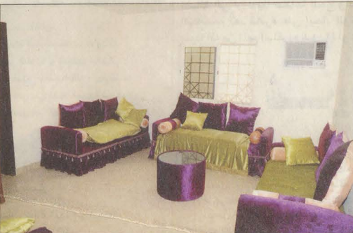
تأثيث السكن بما يناسب المستفيدين